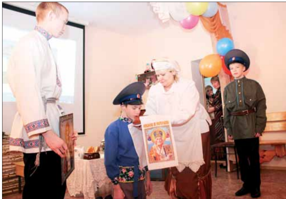
Воспитанники Центра подготовили для гостей небольшое театрализованное представление.

После долгих размышлений в коллективе пришли к выводу, что индивидуальные кухни в семьях необходимы. Общими усилиями провели в здании ремонт, оборудовали комнаты закупили соответствующую мебель, посуду, бытовую технику. Теперь дети питаются не в общей столовой, а имеют возможность в любое время разогреть обед или